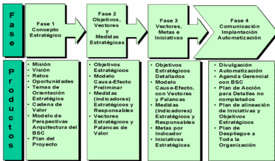
Figura 2. Fases de Implantación